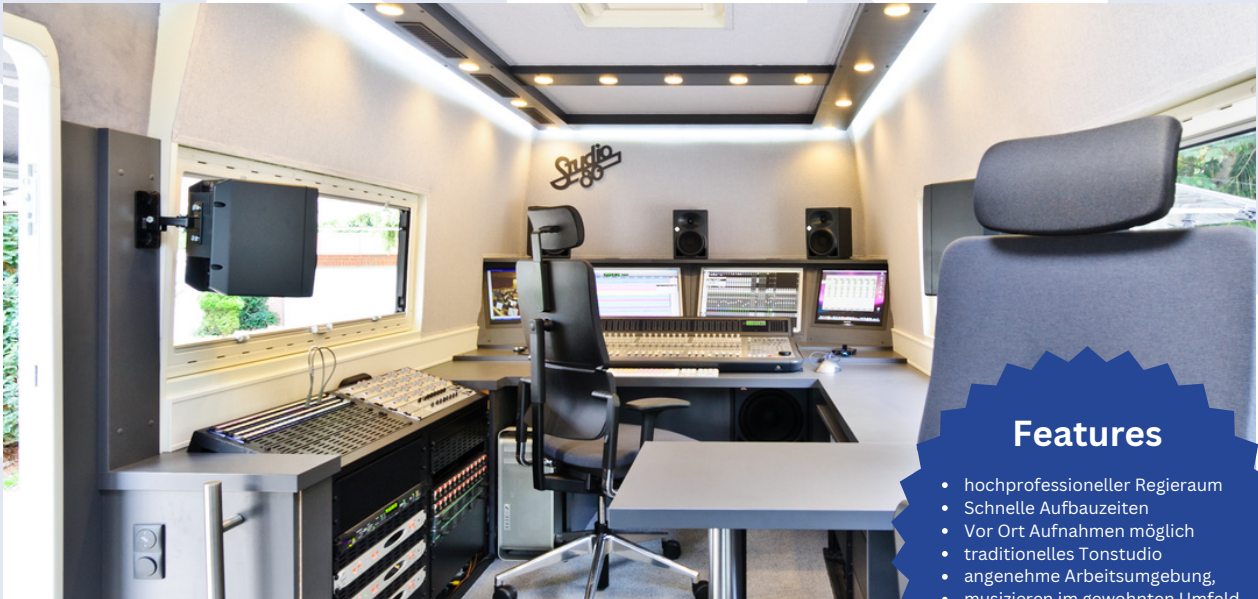
Studio 80 - Mobilstudio