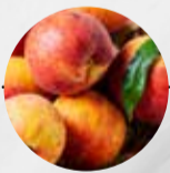
NEKTARINEN (Italien, Spanien, Griechenland)