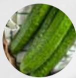
GURKEN (Deutschland, Niederlande, Belgien)