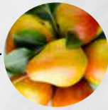
BIRNEN Dr. Guyot (Frankreich)