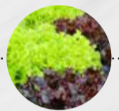
LOLLO ROSSO/LOLLO BIONDA (Deutschland)