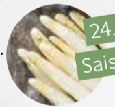
SPARGEL weiß (Deutschland)