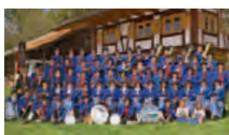
Musikkapelle Memhölz (D)