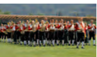
Vereinigte Trachtenkapelle Kleinwalsertal (A)