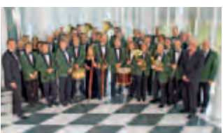
Polizeiorchester Bayern (D)