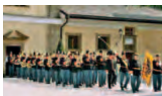
Rainermusik Salzburg (A)